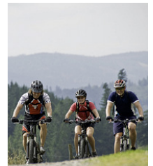
88 km Mountainbikenetz